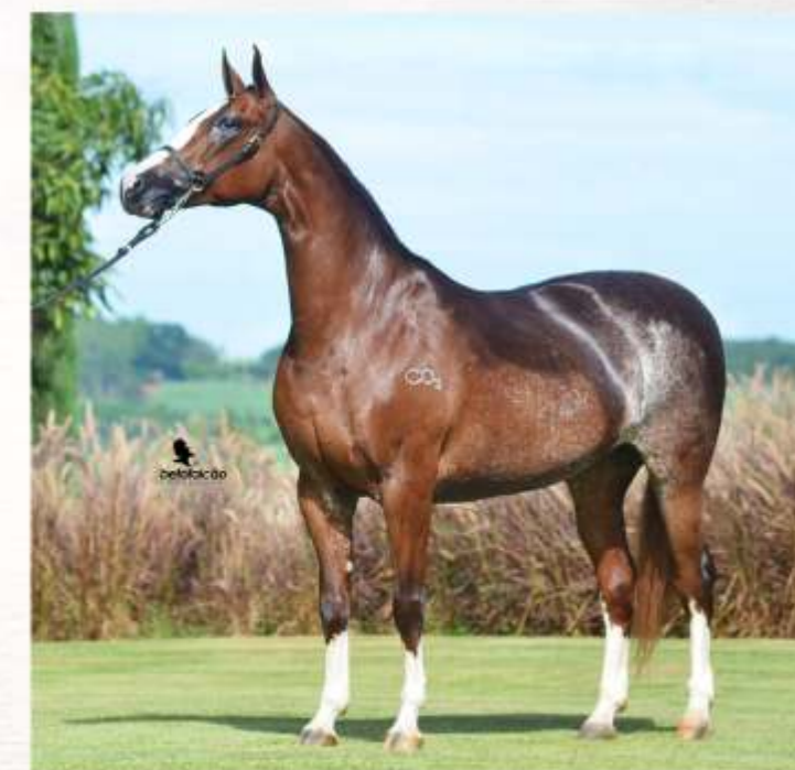
Gabriela do Corumbau (te)