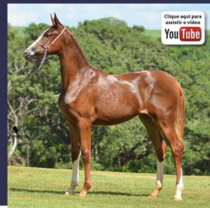
Elise da Sinhá Maria (te) por Esfera do Corumbau Nascimento: 03/09/2020