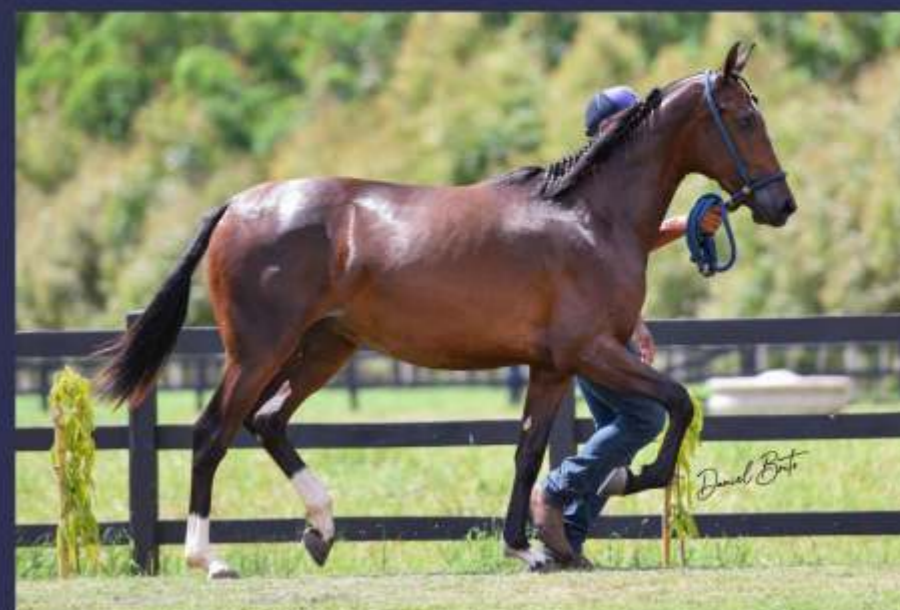
Doidice da Sinhá Maria (te)

Filha de um dos líderes do Ranking de Marcha e linhagem castiça, Popó Juja, na Grande Campeã Brasileira e Reservada Grande Campeã Nacional, Europa da Sabaúna.