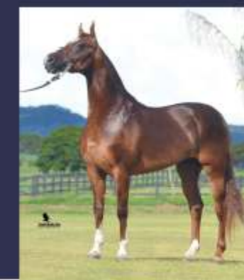
Capilé SP do Papu