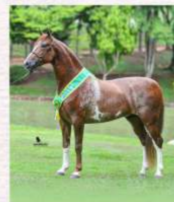
Justiceiro ACF (te)

Caso o produto do ventre ou do embrião seja do sexo masculino, o comprador terá direito a mais 01 (uma) tentativa, sendo que, nesse caso, o macho recém-nascido deverá ser devolvido à vendedora e os custos para a formação do segundo embrião, inclusive cobertura, correrão exclusivamente por conta do comprador.