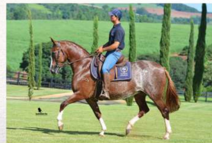
Gabriela do Corumbau (te)