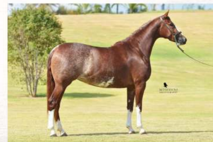
Dileta da Sabaúna (te)