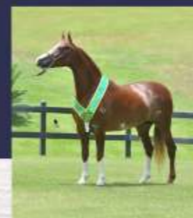
Diamante do Gadu (te)

Caso o produto do ventre ou do embrião seja do sexo masculino, o comprador terá direito a mais 01 (uma) tentativa, sendo que, nesse caso, o macho recém-nascido deverá ser devolvido à vendedora e os custos para a formação do segundo embrião correrão exclusivamente por conta do comprador.