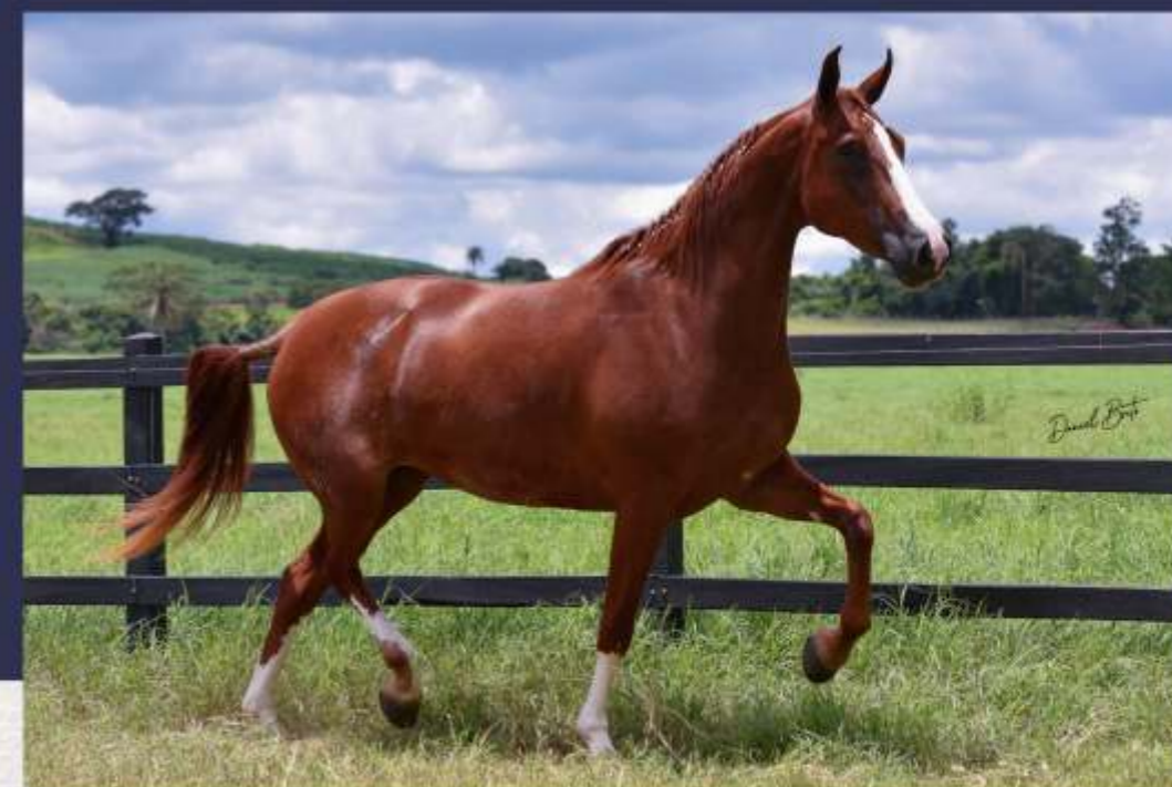
Gabi ACF (te)

Com a finalidade de preservar a genética e as qualidades da Gabi, a Agropecuária Sinhá Maria ofertará 50% (cinquenta por cento) das cotas dessa excepcional égua. O comprador leva Gabi para sua propriedade e com ela permanece por 12 (doze) meses a contar da data de aquisição. Ao fim desse período a égua retorna para a vendedora, alternando-se assim o local de alojamento sucessivamente a cada período de 12 (doze) meses.