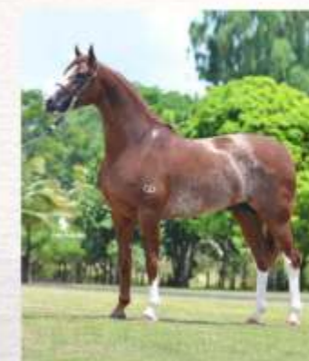
Emblema do Gadu (te)