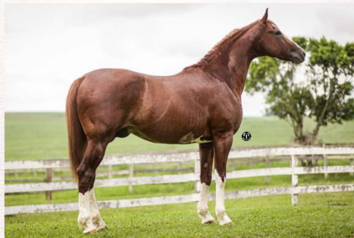
Jambo da Sabauna (te)(lm)

Podem acreditar: somente quem está muito disposto a fazer um grande leilão, um grande evento, disponibiliza o único embrião da estação de uma das principais éguas de seu plantel e da raça Mangalarga.