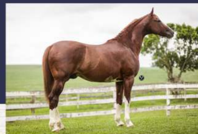
Jambo da Sabaúna (te)(lm)

Caso o produto do ventre ou do embrião seja do sexo masculino, o comprador terá direito a mais 01 (uma) tentativa, sendo que, nesse caso, o macho recém-nascido deverá ser devolvido à vendedora e os custos para a formação do segundo embrião, inclusive cobertura, correrão exclusivamente por conta do comprador.