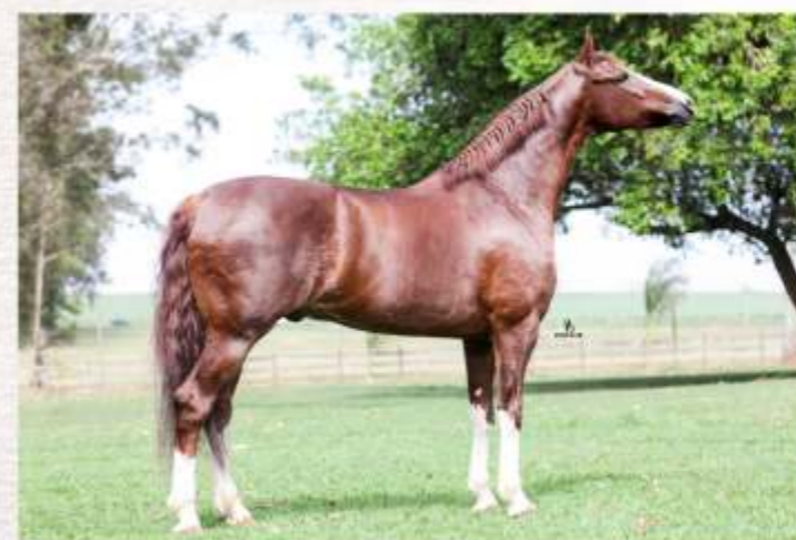
Luxo da Piratininga

A Agropecuária Sinhá Maria disponibilizará 50% (cinquenta por cento) das cotas da Cerimônia, sendo que o comprador terá direito de pista por 24 (vinte e quatro) meses consecutivos contados a partir da data do Leilão, ou seja, o último ano de carreira de potra ao cabresto e o primeiro ano como égua montada, retornando à vendedora após o término de 24 (vinte e quatro) meses da data de compra, sendo que, nos anos subsequentes, o local de alojamento será alternado a cada 12 (doze) meses entre vendedora e comprador.