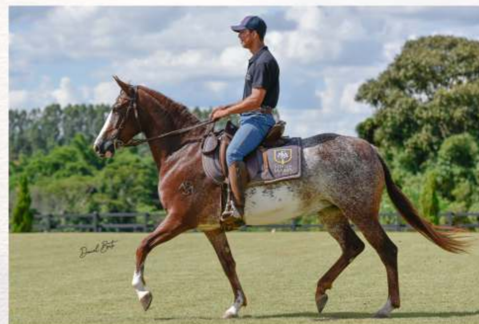
Basílica da Sinhá Maria (te)

A Agropecuária Sinhá Maria disponibilizará 50% (cinquenta por cento) das cotas da Basílica, sendo que o comprador terá direito de pista e alojamento nos primeiros 12 (doze meses) ano após sua aquisição. Ao fim desse período a égua retorna para a vendedora, alternando-se assim o local de alojamento e direito de pista sucessivamente a cada período de 12 (doze) meses.