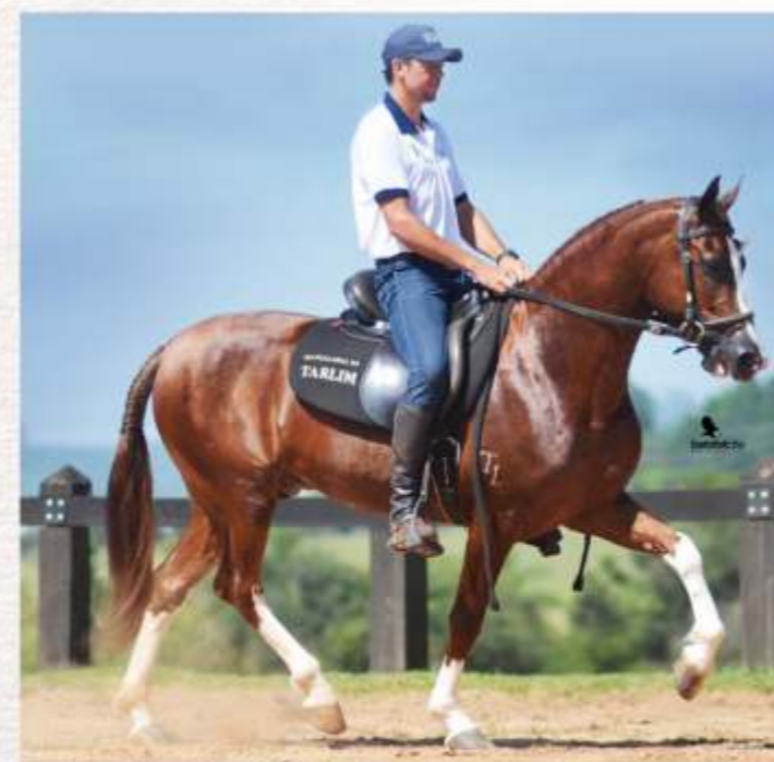
Privilégio da Tarlim (te)

Com a aquisição de 50% das cotas de Donata, o comprador ficará com ela durante toda sua carreira de pista ao cabresto, ou seja, até completar 36 (trinta e seis) meses. Ao completar 36 (trinta e seis) meses, o animal retorna à vendedora e, a partir de então, serão alternados, a cada 12 (doze) meses, entre vendedora e comprador, o local de alojamento do animal e o direito de pista.