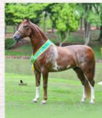
Justiceiro ACF (te)

Emblema é filho de Tangará 42, Grande Campeão Nacional Potro, em Terezinha HGA, que por sua vez é filha de Tereza da Araxá, mãe do Bi Grande Campeão Nacional de Marcha, Batistuta CASS.