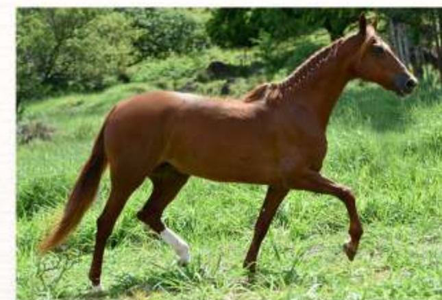
Feiticeira do Dado

Caso o produto do ventre ou do embrião seja do sexo masculino, o comprador terá direito a mais 01 (uma) tentativa, sendo que, nesse caso, o macho recém-nascido deverá ser devolvido à vendedora e os custos para a formação do segundo embrião correrão exclusivamente por conta do comprador.