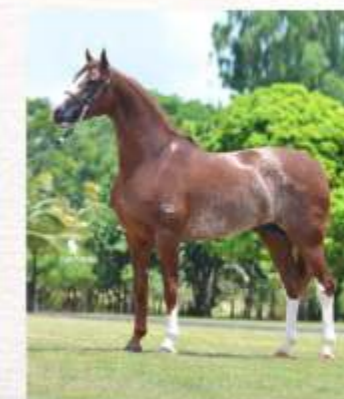
Emblema do Gadu (te)