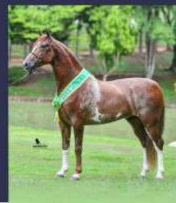
Justiceiro ACF (te)

Caso o produto do ventre ou do embrião seja do sexo masculino, o comprador terá direito a mais 01 (uma) tentativa, sendo que, nesse caso, o macho recém-nascido deverá ser devolvido à vendedora e os custos para a formação do segundo embrião correrão exclusivamente por conta do comprador.