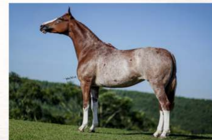
Típica do Otnacer (te)