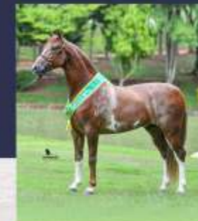
Justiceiro ACF (te)