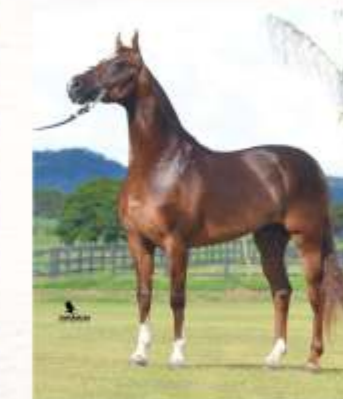
Capilé SP do Papu