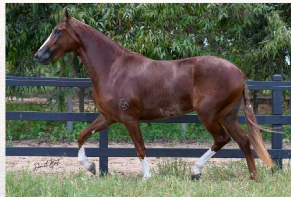
Caridade da Sinhá Maria (te)

No entanto, na batida do martelo o comprador poderá manifestar seu interesse em ficar com 100% (cem por cento) do animal, situação em que o valor de compra será igualmente dobrado.