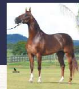
Capilé SP do Papu