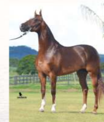
Capilé SP do Papu