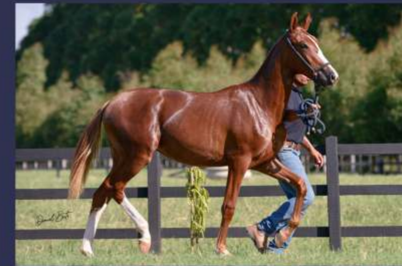
Diretriz da Sinhá Maria

Potra para compor time de pista e futura matriz em qualquer haras.