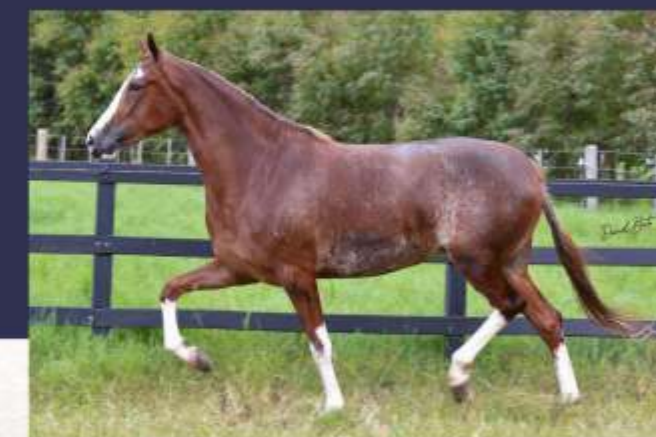
História do Gadu (te)