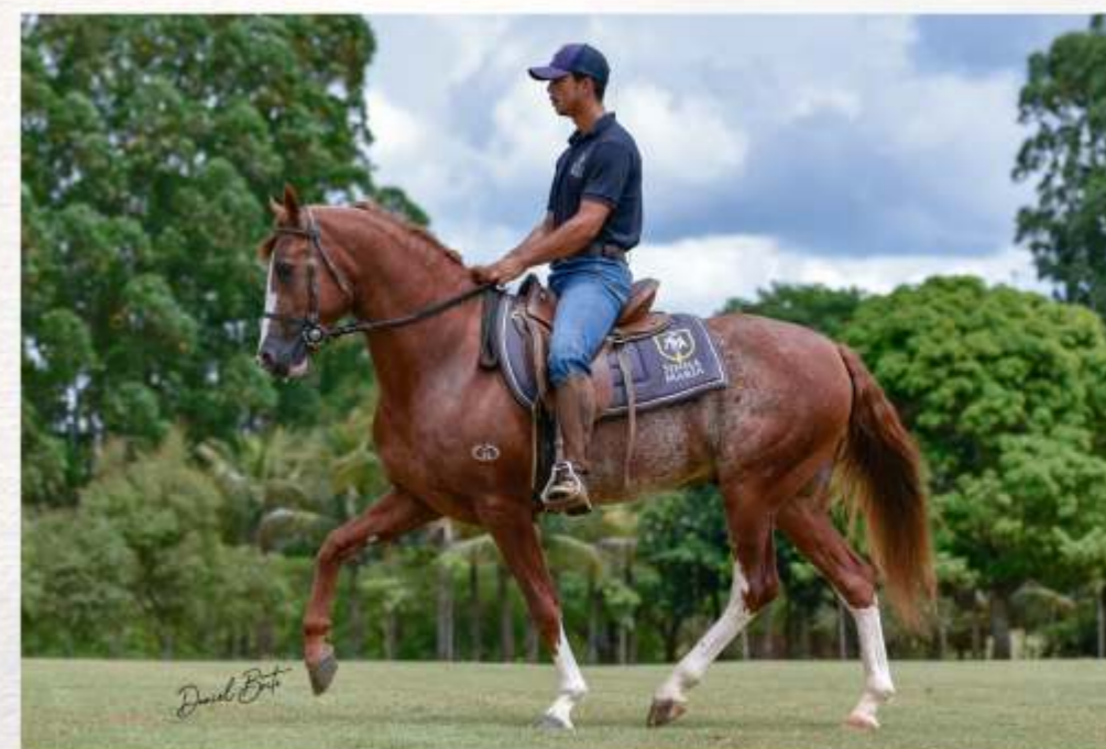
Emblema do Gadu (te)

Emblema foi Reservado Campeão Nacional de Marcha e Geral em 2019 e Primeiro Reservado Grande Campeão Nacional Cavalo Completo, mostrando assim todo seu equilíbrio dinâmico morfológico