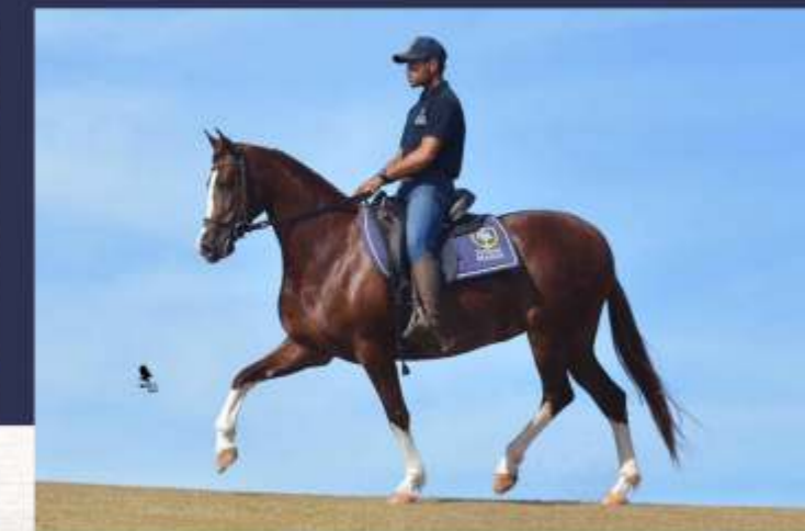
Europa da Sabaúna (te)