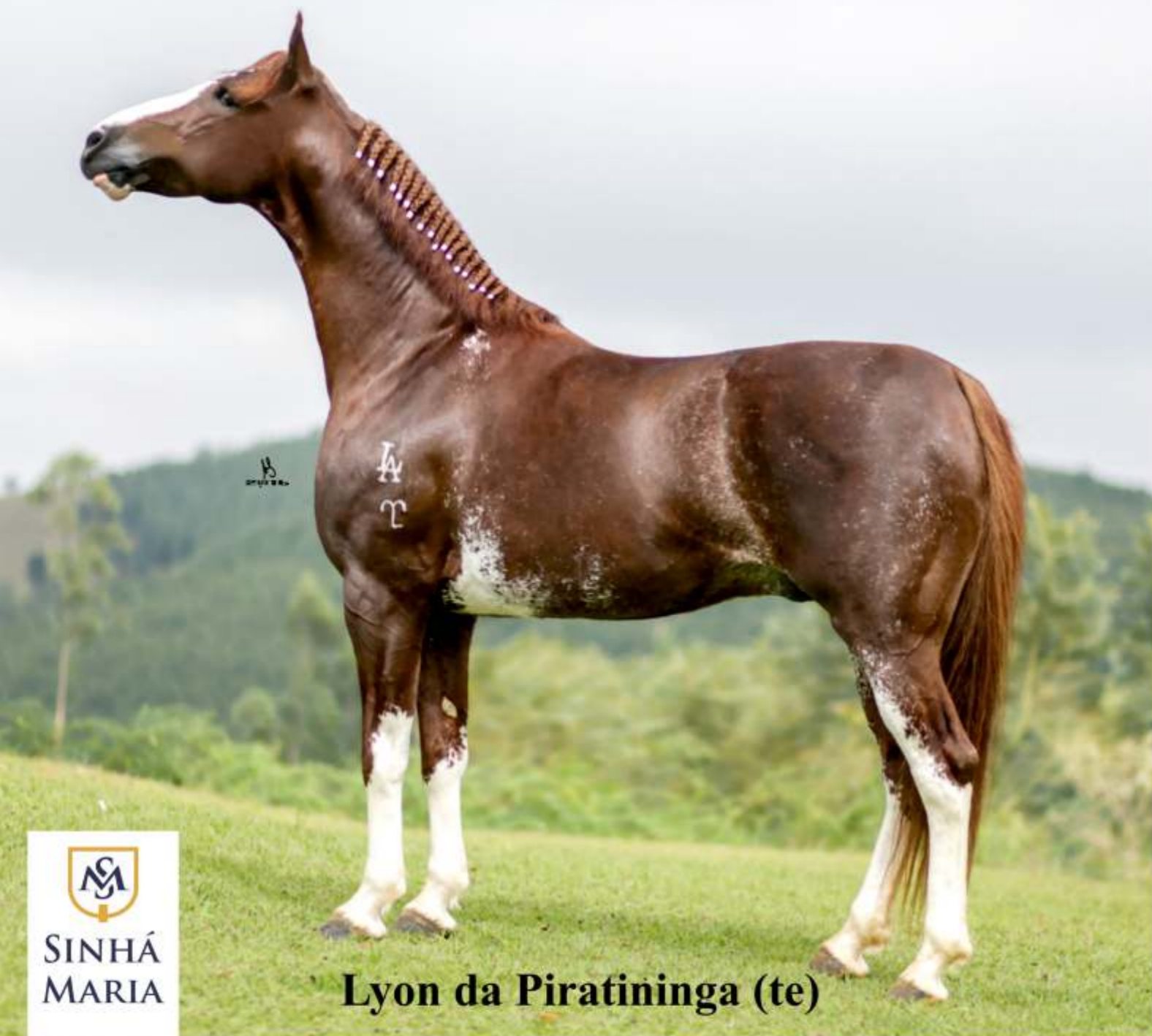
Lyon da Piratininga (te)