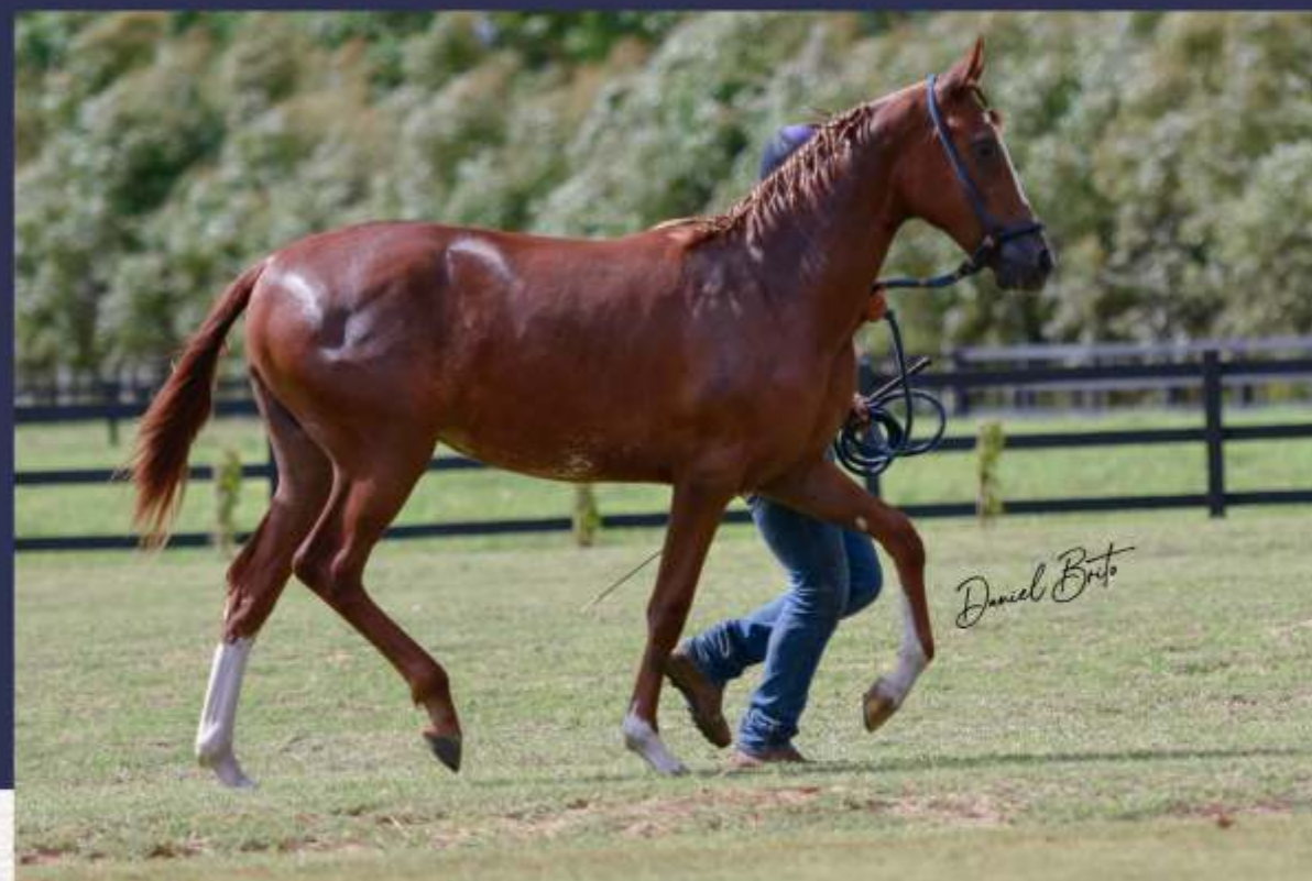
Distração da Sinhá Maria (te)

Com a aquisição de 50% das cotas de Distração, o comprador ficará com ela durante toda sua carreira de pista ao cabresto, ou seja, até completar 36 (trinta e seis) meses. Ao completar 36 (trinta e seis) meses, o animal retorna à vendedora e, a partir de então, serão alternados, a cada 12 (doze) meses, entre vendedora e comprador, o local de alojamento do animal e o direito de pista.