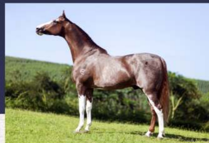
Prêmio do Otnacer (te)

Na batida do martelo o comprador faz a opção por uma das dessas éguas e adquire 50% (cinquenta por cento) das cotas da escolhida. O comprador leva a égua que escolher para sua propriedade e com ela permanece por 12 (doze) meses a contar da data de aquisição. Ao fim desse período a égua retorna para a vendedora, alternando-se assim o local de alojamento sucessivamente a cada período de 12 (doze) meses.