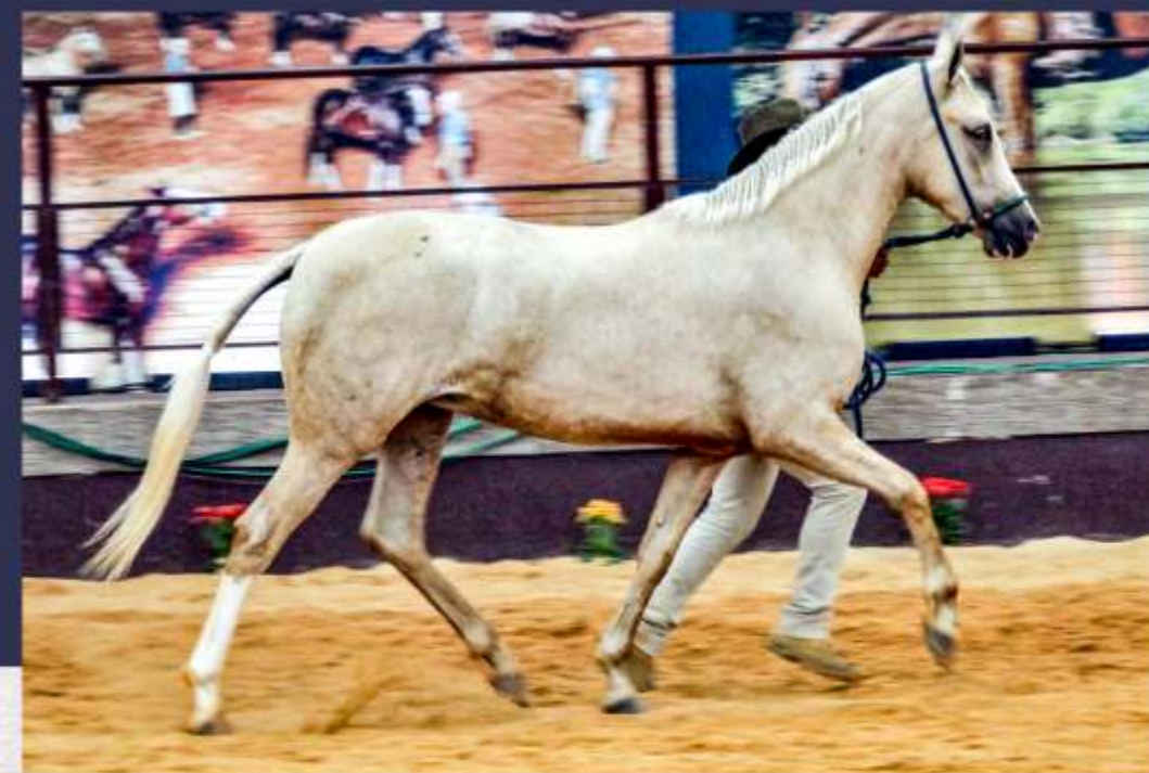
Carência da Sinhá Maria (te)

A Agropecuária Sinhá Maria disponibilizará 100% das cotas da Carência, para que o comprador possa disputar na cabeceira das melhores e mais fortes exposições do Mangalarga.