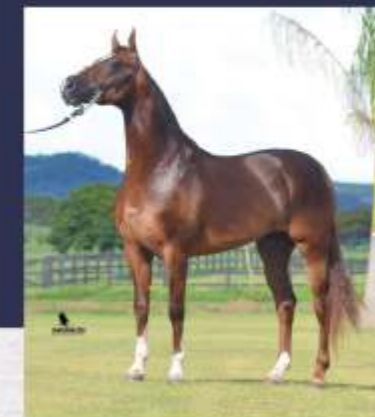
Capilé SP do Papu