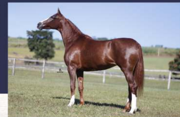
Basheera OJC (te)