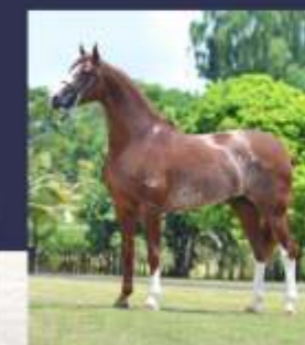
Emblema do Gadu (te)