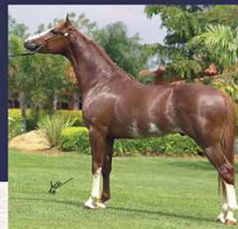
Quartzo JES (te)

Com a aquisição de 50% das cotas de Estela, o comprador ficará com ela durante toda sua carreira de pista ao cabresto, ou seja, até ela completar 36 (trinta e seis) meses. Ao completar 36 (trinta e seis) meses, o animal retorna à vendedora e, a partir de então, serão alternados, a cada 12 (doze) meses, entre vendedora e comprador, o local de alojamento do animal e o direito de pista.