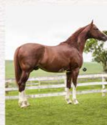
Jambo da Sabauna (te)