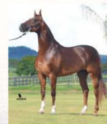
Capilé SP do Papu