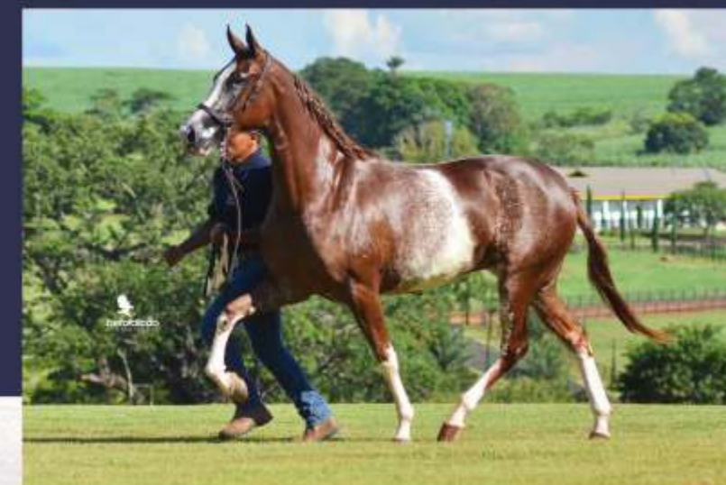
Cortesia da Sinhá Maria (te)

A Agropecuária Sinhá Maria disponibilizará 50% (cinquenta por cento) das cotas da Cortesia, sendo que o comprador terá direito de pista por 24 (vinte e quatro) meses consecutivos contados a partir da data do Leilão, ou seja, o último ano de carreira de potra ao cabresto e o primeiro ano como égua montada, retornando à vendedora após o término de 24 (vinte e quatro) meses da data de compra, sendo que, nos anos subsequentes, o local de alojamento será alternado a cada 12 (doze) meses entre vendedora e comprador.