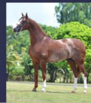
Emblema do Gadu (te)