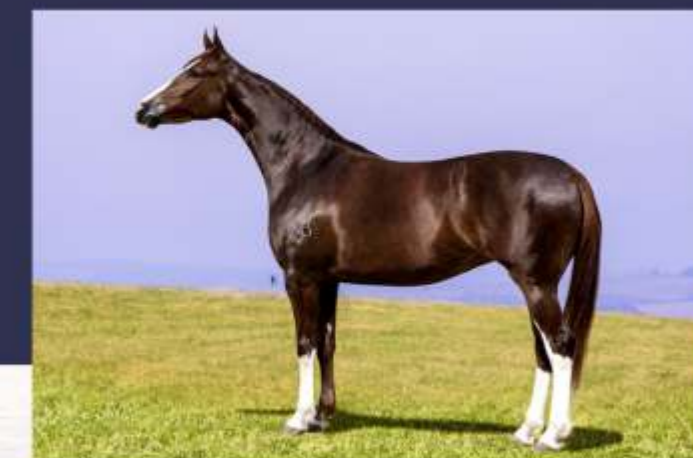
Estela NLB (te)