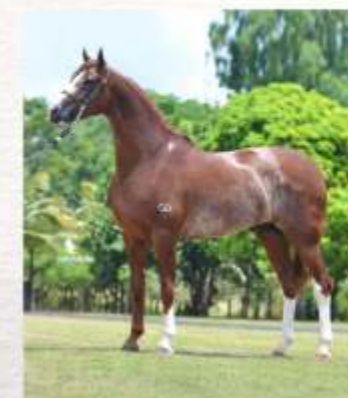
Emblema do Gadu (te)