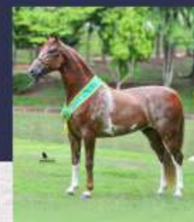
Justiceiro ACF (te)