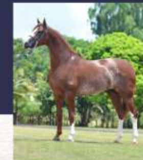
Emblema do Gadu (te)