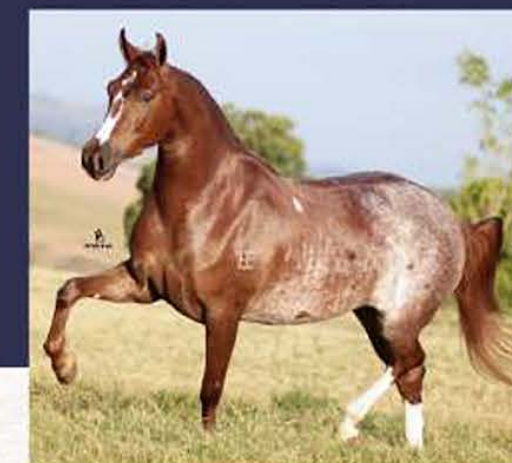
Uberlândia do AEJ (te)