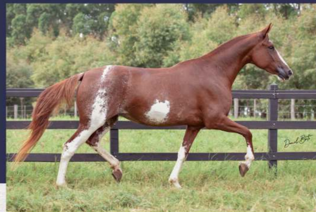
Cafeína do Sheik

Com a finalidade de preservar essa genética e as qualidades da Cafeína, a Agropecuária Sinhá Maria ofertará 50% (cinquenta por cento) das cotas dessa excepcional égua. O comprador leva Cafeína para sua propriedade e com ela permanece por 12 (doze) meses a contar da data de aquisição. Ao fim desse período a égua retorna para a vendedora, alternando-se assim o local de alojamento sucessivamente a cada período de 12 (doze) meses.