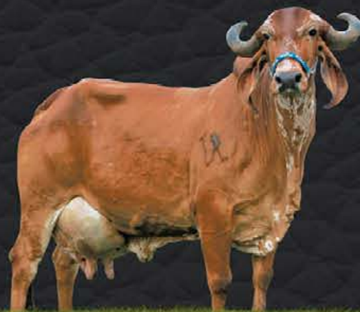
FOFURA FIV NORMAL FUB - MÃE