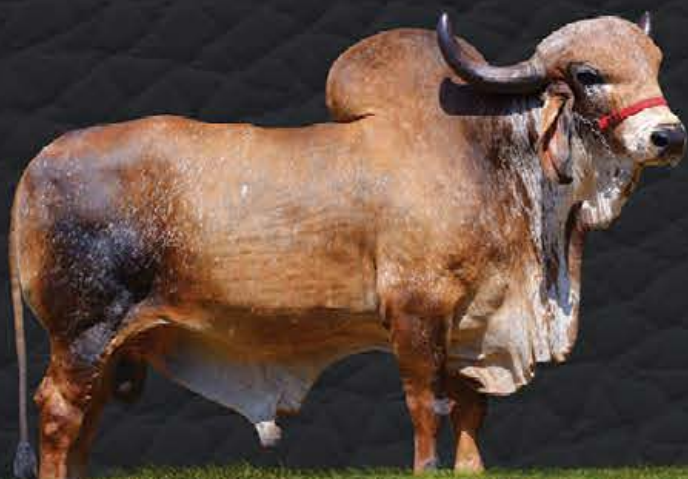
DIAMANTE TE DE BRASÍLIA - AVÔ MATERNO