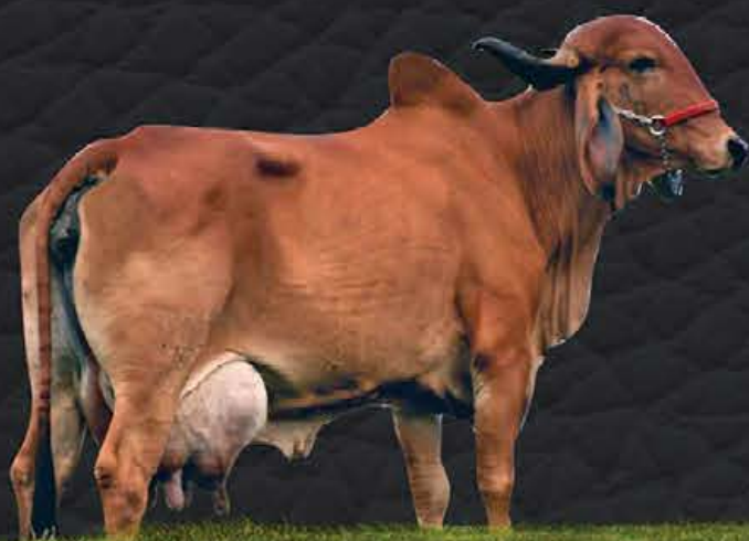
UNIÃO TE DE BRASÍLIA - AVÓ MATERNA