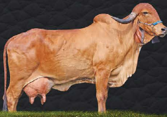
HORTÊNCIA FIV CÓRREGO BRANCO - MÃE

- Segue com prenhez confirmada de embrião 1/2 sangue - Sx Fêmea (CRUSHABULL-ET x IMPERATRIZ F.RECREIO (GENGIS KHAN DE BRASÍLIA x BANDEIRA)) e parto previsto para 11/11/2020.