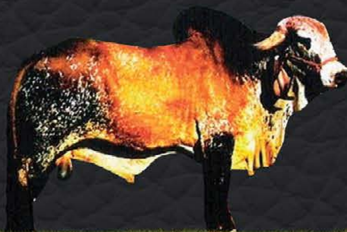
MIG 3R DE UBERABA - AVÔ MATERNO