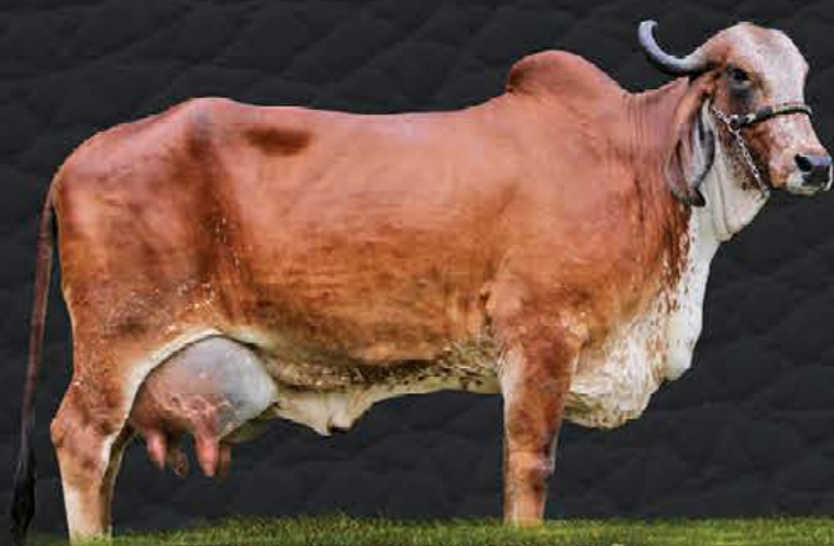
TIRICA FIV DA PALMA - MÃE