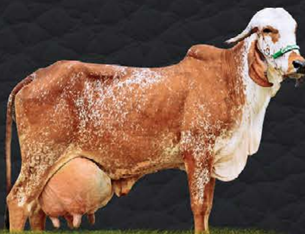
ARAÇÁ CAL - MÃE

Gir Leiteiro Ribeirão Grande oferta neste grande evento, um lote de extrema grandeza. Lote livre escolha de 100% de cada doadora. Ladeira FIV Cal, Grande Campeã Torneio Leiteiro Luziânia/19, uma descendente direta da renomada doadora para Araça Cal. Flotilha FIV Cal mais uma fiel representante da tradicional linhagem Calciolândia, uma das melhores filhas da grande Nigéria da Cal, lote para quem busca o que há de melhor no Gir Leiteiro!! Flotilha é mãe de Tassia FIV Rib. Grande, Campeã Bezerra Nacional/19. Escolha sua preferida!!!