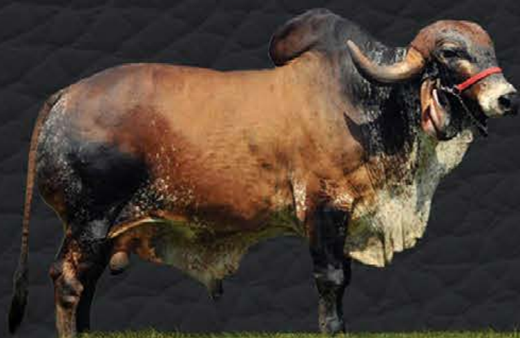
JAGUAR TE DO GAVIÃO - AVÔ MATERNO