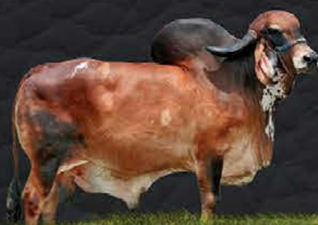
FARDO F MUTUM - AVÓ MATERNO

UECKER SUPERSIRE JOSUPER-ET x GARÇA FIV CÓRREGO BRANCO