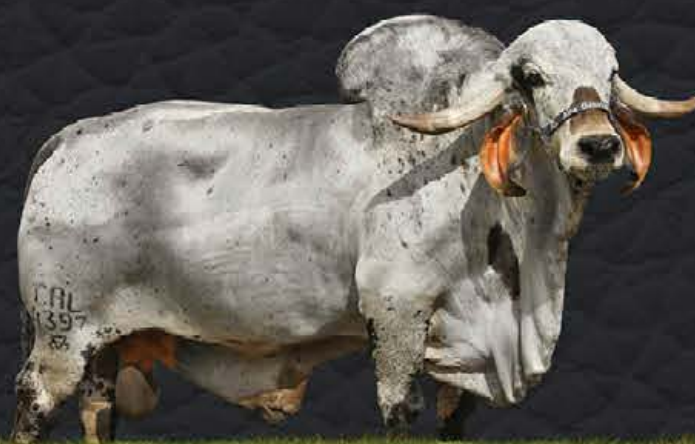
NOBRE TE CAL - AVÔ MATERNO