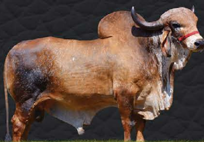
DIAMANTE TE BRASÍLIA - AVÔ MATERNO