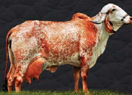
CICA RIBEIRÃO GRANDE - AVÓ MATERNA