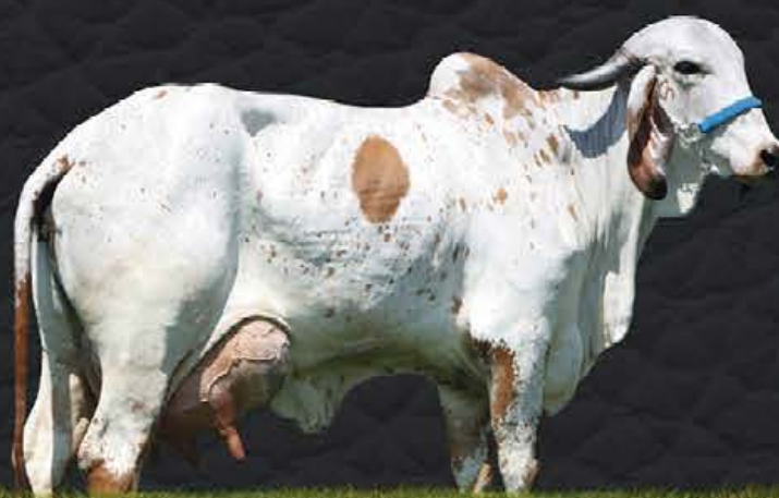
NOCA FIV. S. HUMBERTO - MÃE

- Segue com prenhez confirmada de embrião 1/2 sangue - Sx Fêmea (JEDI x NOCA FIV S. HUMBERTO (C.A.SANSÃO x EPOPÉIA S. HUMBERTO)) e parto previsto para 23/02/2021.