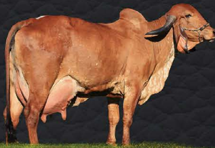
UVEDÁLIA CAL - AVÓ MATERNA

- Segue com prenhez confirmada de embrião 1/2 sangue - Sx Fêmea (JEDI x INAIÊ FIV CÓRREGO BRANCO) e parto previsto para 23/02/2021.