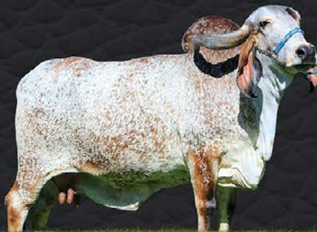
PAINEIRA DA CAL - AVÓ MATERNA