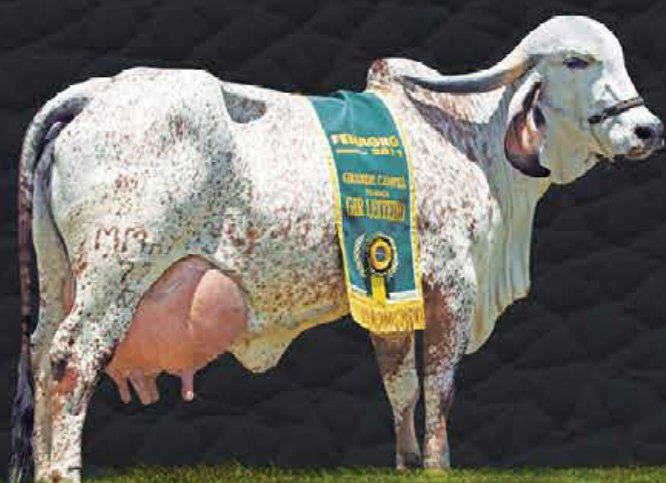
ODISSÉIA DONA BEJA - AVÓ MATERNA

RGD 0153BK - BT ACN0046 - CCG - 1/2 HOL + 1/2 GIR FÊMEA - NASC.:05/01/2019