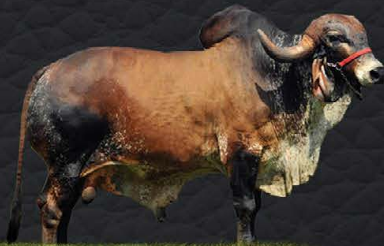
JAGUAR TE DO GAVIÃO - AVÔ MATERNO

- Último parto em 28/06/2020; - Produção diária em controle oficial: 30,2kg; - Lactação oficial em andamento: 51 dias - 1.469,27kg.