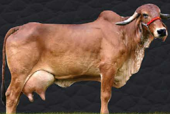
TAPUIA DE BRASÍLIA - AVÓ MATERNA

15.226,0KG DE LEITE / VG.: 1.586,6KG DE LEITE