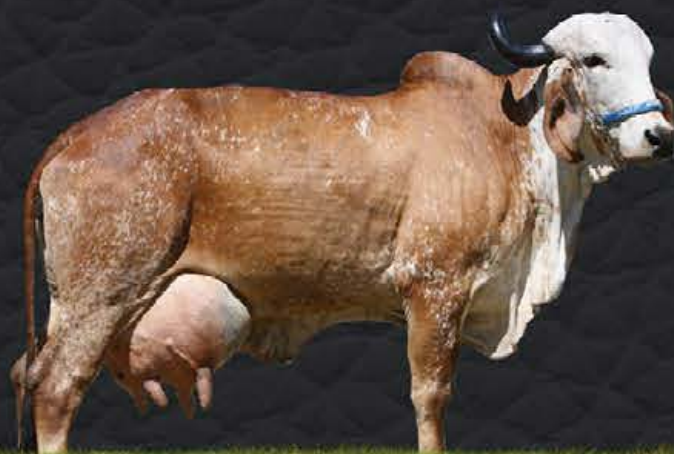
URUMA CAL - MÃE