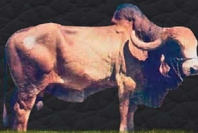
GAIOLÃO DC - BISAVÔ MATERNO

- Último parto em 20/05/2020; - Produção diária em controle oficial: 39.6kg; - Lactação oficial em andamento: 90 dias - 2.541,19kg; - Segue com prenhez confirmada de embrião 1/2 sangue (DAWSON x IMPRENSA) e parto previsto para 27/04/2021.