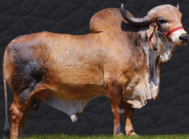
DIAMANTE TE DE BRASÍLIA - AVÔ MATERNO