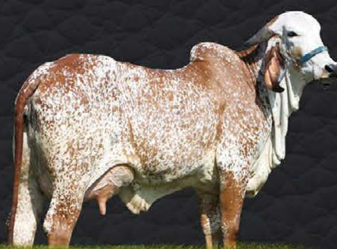
C.A.JOSÉLIA TE - MÃE

- Segue com prenhez confirmada de embrião 1/2 sangue - Sx Macho (JEDI x ELKE MILK CENTER) e parto previsto para 23/02/2021.