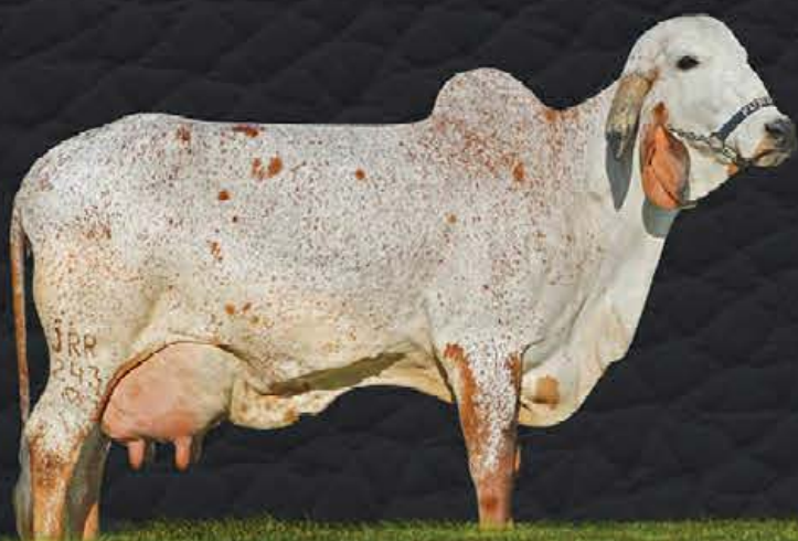
QUERMESSE DO FUNDÃO - AVÓ MATERNA