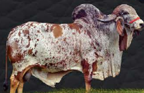
SUPRA SUMO - AVÔ MATERNO