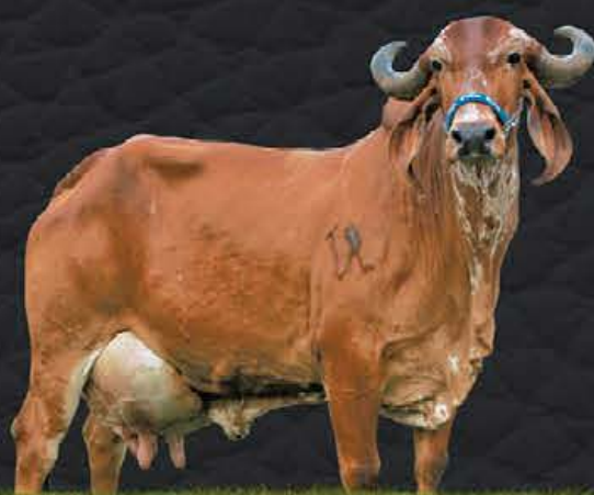
FOFURA VILA RICA - MÃE