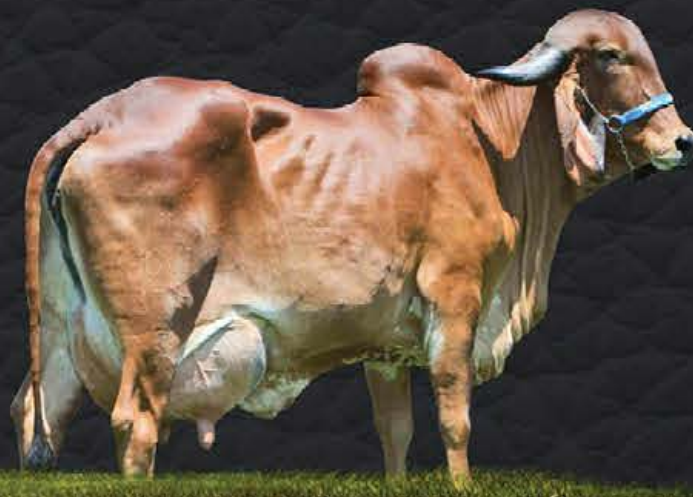
AJALA FIV CABO VERDE - AVÓ MATERNA

- Segue com prenhez confirmada de embrião 1/2 sangue - Sx Fêmea (DAWSON x BANDEIRA VERDE FIV CÓRREGO BRANCO) e parto previsto para 05/01/2021.