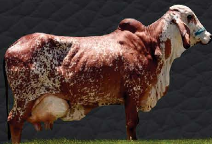
FADA VILA RICA - AVÓ MATERNA