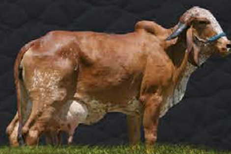
SINTA BF TE DA CAL - AVÓ MATERNA