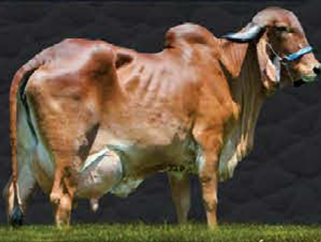
AJALA FIV CABO VERDE - AVÓ MATERNA