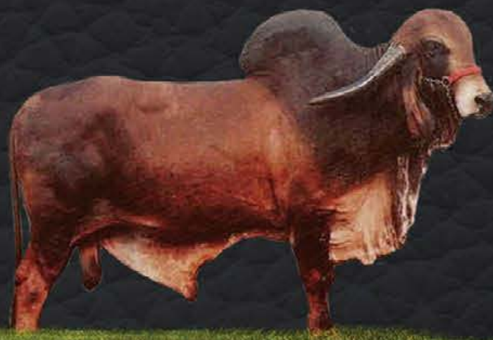
RADAR DOS POÇÕES - AVÓ MATERNO

- Último parto em 16/05/2020; - Produção diária em controle oficial: 44.9kg; - Lactação oficial em andamento: 94 dias - 3.054.98kg.