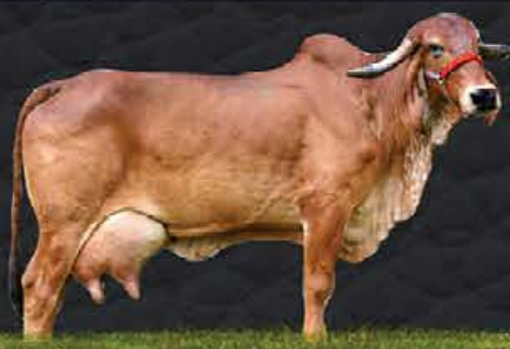
TAPUIA DE BRASÍLIA - AVÓ MATERNA