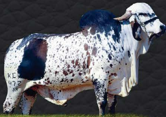
C.A. SANSÃO - AVÔ MATERNO

- Último parto em 18/05/2020; - Produção diária em controle oficial: 39,0kg; - Lactação oficial em andamento: 92 dias - 2.845,46kg.