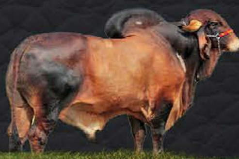
EXPOENTE - AVO MATERNO