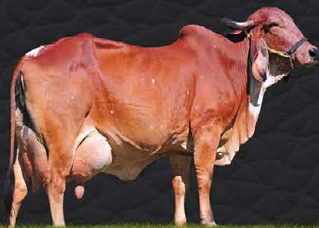
FÁBRICA FIV DE BRASÍLIA - MÃE

Oferta que abrilhanta muito este grande evento!!! Uma descendente direta da Grande Campeã Torneio Leiteiro Expozebu e Recordista do Torneio, Fábrica de Brasília. Família de destaque nas duas primeiras avaliações genômicas do Gir Leiteiro. Jubaia reúne genética de ponta, alto desempenho produtivo e reprodutivo. Oportunidade de adquirir 50% das cotas desta grande doadora, ficando sócio deste projeto inovador: ACN Agropecuária. Segue com prenhez confirmada de embrião GIR (SERVO FIV RIB. GRANDE x JUBAIA FIV DO BASA (C.A.SANSÃO x FÁBRICA FIV DE BRASÍLIA)) e parto previsto para Setembro/2020