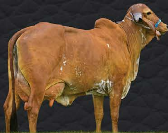
HÉLICE FIV CÓRREGO BRANCO - MÃE