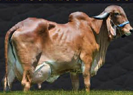
AJALA FIV CABO VERDE - MÃE