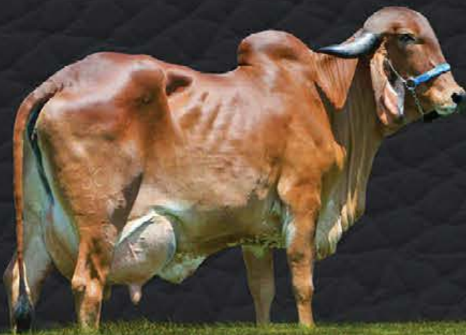
AJALA FIV CABO VERDE - MÃE