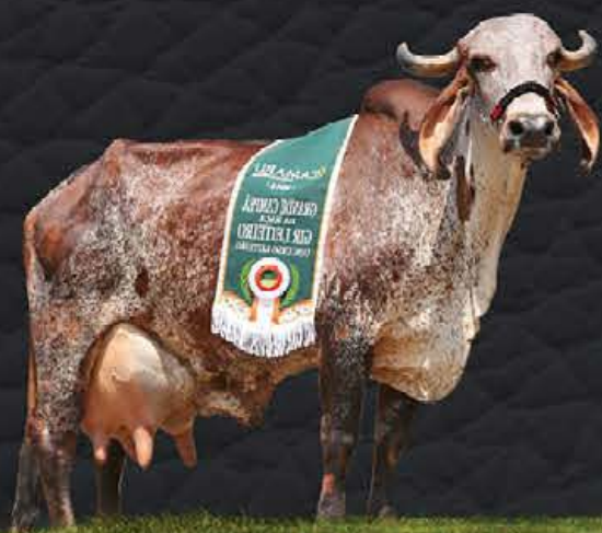
JACI FIV DE BRASÍLIA - AVÓ MATERNA