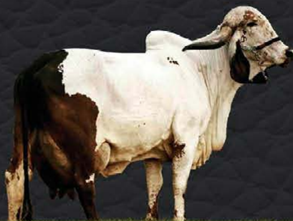
ELIZA FIV VIA TEATRO FUB - MÃE