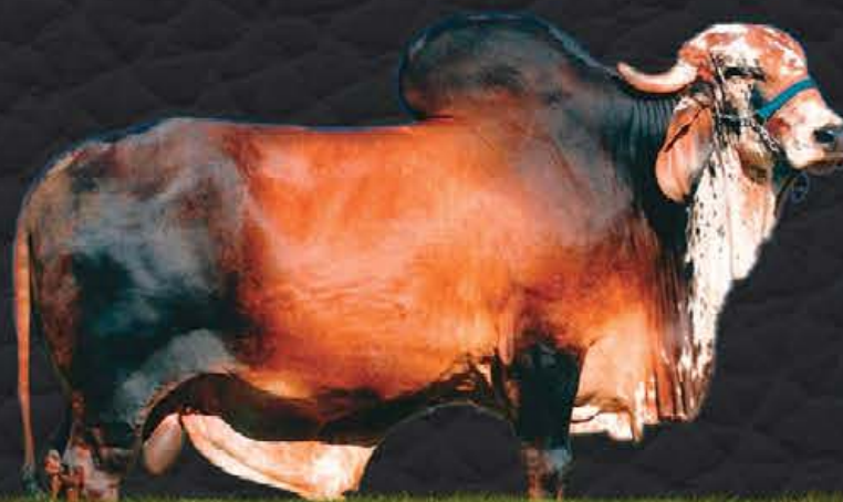
CASPER TE KUBERA - AVÔ MATERNO