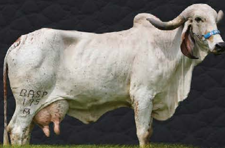
GARUPA FIV DO BASA - MÃE

- Último parto em 22/05/2020; - Produção diária em controle oficial: 28.8kg; - Lactação oficial em andamento: 88 dias - 2.342,82kg.