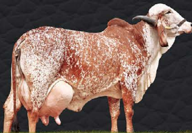
OMISKA DA PALMA - AVÓ MATERNA

Flora é destaque na safra 2020 nascida na fazenda, bezerra extremamente moderna e competitiva, representa a modernidade da nova geração ACN.