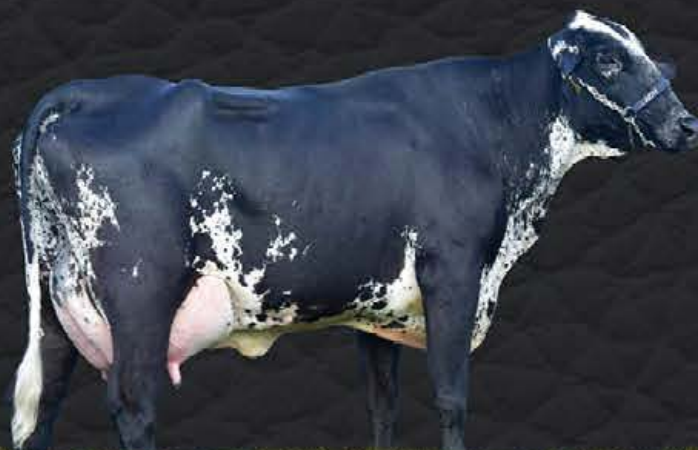
ALUNITAFIV RIBEIRÃO GRANDE - IRMÃ PRÓPRIA

Agradável é um dos grandes destaques deste leilão, é pista, é torneio leiteiro, é doadora extremamente completa, precoce e produtiva!