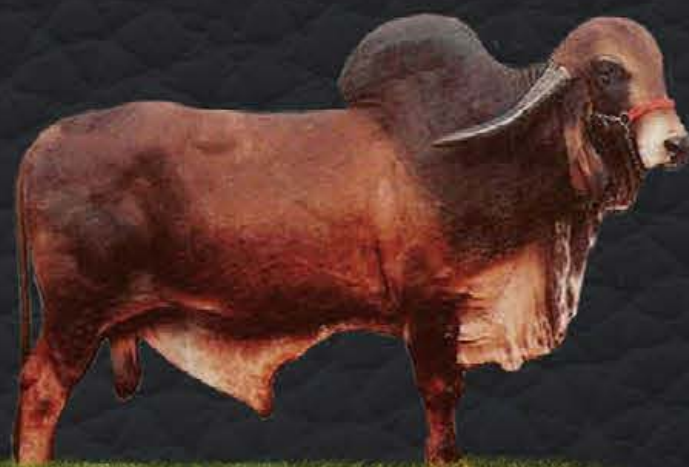
RADAR DOS POÇÕES - AVÔ MATERNO

- Último parto em 25/05/2020; - Produção diária em controle oficial: 43,9kg; - Lactação oficial em andamento: 85 dias - 2.848,87kg