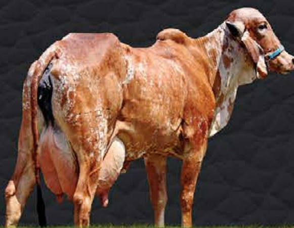
BANDEIRA - MÃE

ACN Agropecuária oferta 50% das cotas de Imperatriz F. Recreio, reserva total da ACN Agropecuária, uma descendente direta da Tri-Recordista Mundial de Produção, Bandeira com o líder do PNMGL, Gengis Khan de Brasília. Estrutura, volume corporal, genética de extrema qualidade e muita força leiteira, são os pontos fortes de Imperatriz. Segue com prenhez confirmada de embrião GIR (SANSÃO x HÉLICE FIV CÓRREGO BRANCO) Sex Fêmea, e parto previsto para 17/03/2021.