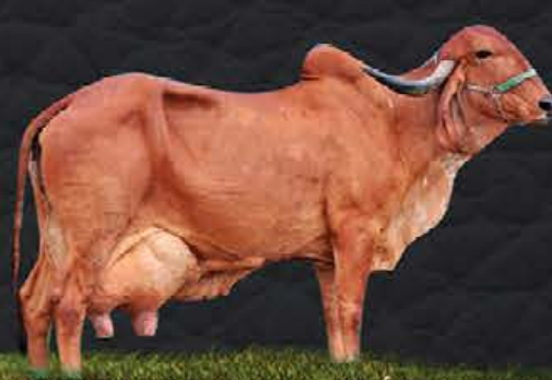
SAFADA TE DA CAL- AVÓ MATERNA