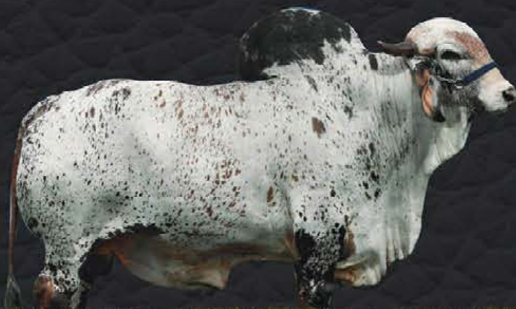
ESPELHO TE DE BRASÍLIA - AVÔ MATERNO