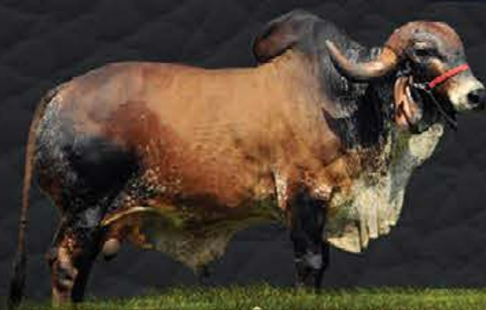
JAGUAR TE - AVÔ MATERNA