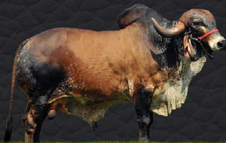
JAGUAR TE DO GAVIÃO - AVÔ MATERNO