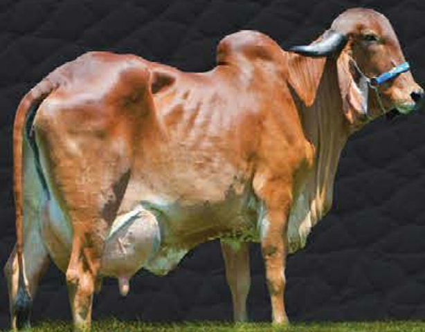
AJALA CABO VERDE - AVÓ MATERNA

RGD 0178BK - BT ACN0067 - CCG - 1/2 HOL + 1/2 GIR FÊMEA - NASC.:18/01/2019