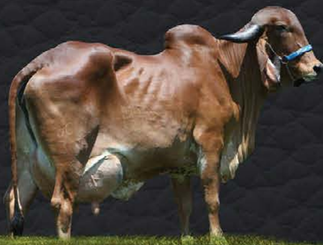
AJALA FIV CABO VERDE - MÃE

- Segue com prenhez confirmada de embrião 1/2 sangue - Sx Fêmea (DAWSON x BANDEIRA VERDE FIV CÓRREGO BRANCO) e parto previsto para 05/01/2021.