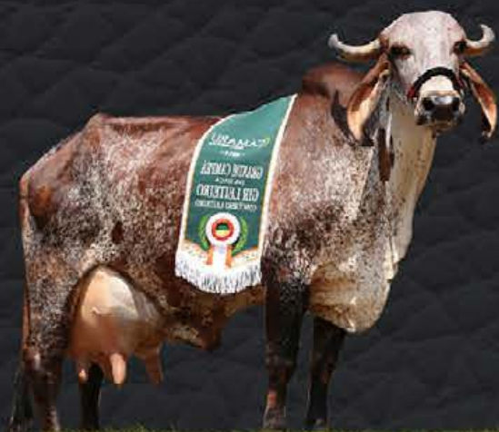
JACI FIV DE BRASÍLIA - AVÓ MATERNA