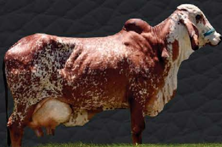
FADA VILA RICA - AVÓ MATERNA