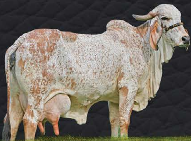
DULCE TE DE BRASÍLIA - BISAVÓ MATERNA