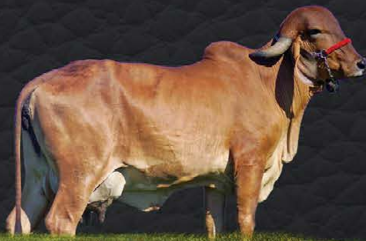
BALSA TE KUBERA - BISAVÓ MATERNA

- Segue com prenhez confirmada de embrião 1/2 sangue - Sx Fêmea (DAWSON x JADE FIV CÓRREGO BRANCO) e parto previsto para 05/01/2021.