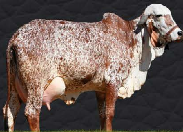
VISITA FIV JMMA - AVÓ MATERNA

ACN disponibiliza em seu primeiro leilão, a melhor bezerra da safra 2019, reserva absoluta do time de pista, Kafra está pronta para disputar as mais pesadas pistas de julgamento da raça.