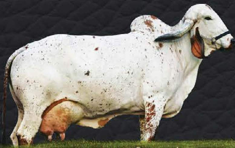
NOGUEIRA DO FUNDÃO - AVÓ MATERNA