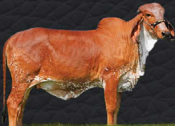
TASSIA FIV RIBEIRAO GRANDE - FILHA CAMPEÃ NACIONAL BEZERRA 2019