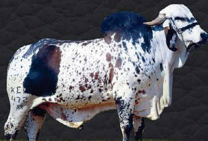
C.A. SANSÃO - AVÔ MATERNO

- Último parto em 29/05/2020; - Produção diária em controle oficial: 37.1kg; - Lactação oficial em andamento: 81 dias - 2.490,0kg.