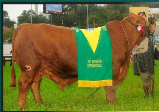
Panzer - Reservado de Grande Campeão da Expinter

Parida fêmea 640 8/5/20 Hemingway. "003 BONECA" é própria IRMÃ DE PANZER, mesma coleta. Já deixou enorme prole na SÃO MANOEL. Oportunidade de adquirir DOADORA ÚNICA NA RAÇA. Parida de uma FÊMEA excepcional filha de HEMINGWAY.