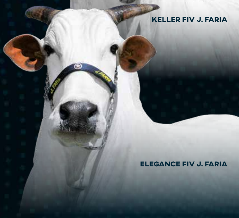
ELEGANCE FIV J. FARIA