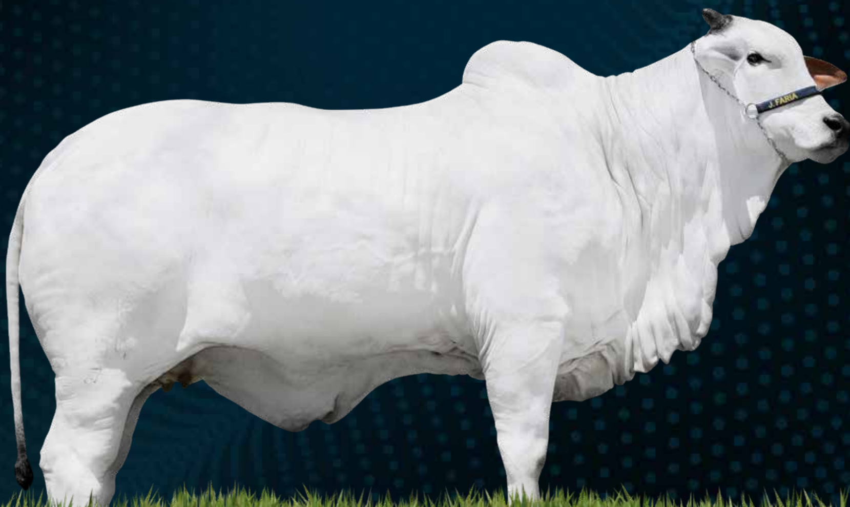
MAHARASHI TE J. GALERA

RG.: NELF 1094 - Nasc.: 21/6/2016 - Sexo: Fêmea