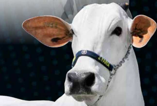
PERSIANA FIV J. FARIA